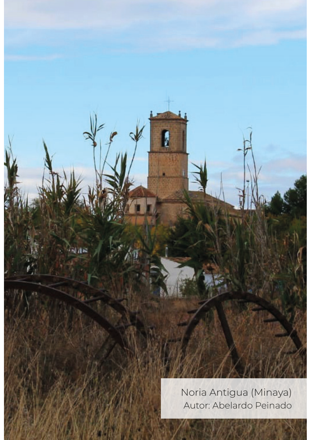
Noria Antigua (Minaya) Autor: Abelardo Peinado